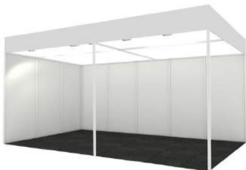
Simulación de stand modular 5x3 sin probador