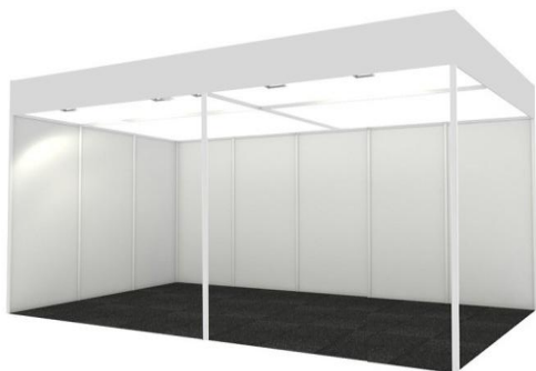
Simulación de stand modular 5x3 sin probador